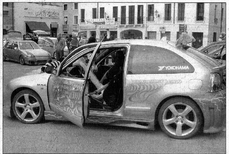
Auto e premiati del Lendi Day dedicato al tuning